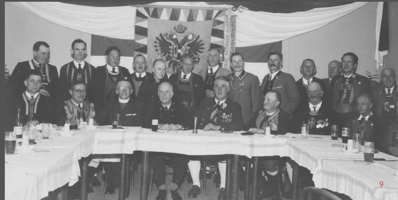
1950 Gründung des „Landesverband der Schützenkompanien Tirols“

Die Organisationsstruktur im Bund der Tiroler Schützenkompanien zieht sich hierarchisch vom Bund mit dem Landeskommandanten und der Bundesleitung (oberstes Leitungsgremium) über die 4 Viertel (Oberland, Tirol Mitte, Unterland, Osttirol), 2 Regimenter, 27 Bataillone, Bezirke und Talschaften bis hin zu den 235 Kompanien und umfasst somit inkl. der Trommlerzüge 272 Organisationseinheiten, die zum überwiegenden Teil eigens geführte Vereine mit eigenen Zuständigkeitsbereichen und Aufgaben sind. Die Viertelkommandanten werden jeweils von den Viertelversammlungen gewählt und haben dadurch Sitz und Stimme in der Bundesleitung.