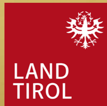
Ihr Anton Mattle Landeshauptmann von Tirol

Denn Sie alle, die diesen beiden Verbänden angehören, helfen durch ihren ehrenamtlichen Einsatz, die Pflege der Tradition und das Hochhalten ehrwürdiger Werte, das Miteinander in unserem Land Tirol zu stärken. In diesem Sinne wünsche ich allen einen erfolgreichen Verlauf dieser Großveranstaltung sowie viel Freude im Kreise Gleichgesinnter!